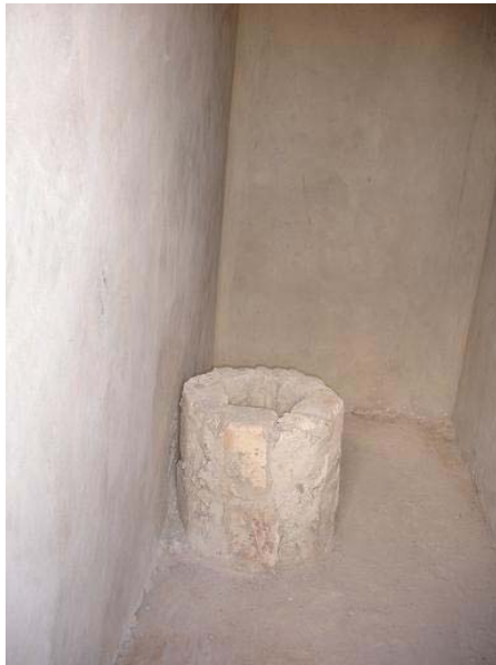
▪ Toiletten begin oktober 2009

In Ogoekrom werd in oktober 2009 de realisatie van openbare toiletten afgerond. In 2008 is hiervoor een geschikt terrein voor uitgekozen en zijn door de lokale bevolking de graafwerkzaamheden verricht. Onder toezicht van Friedl is vervolgens in 2009 gestart met de bouw van de toiletten. Tijdens het bezoek van Loop naar de Pomp in oktober 2009 zijn de toiletten helemaal afgewerkt – zelfs inclusief toiletbril - en deze zijn door een enthousiaste menigte in gebruik genomen.