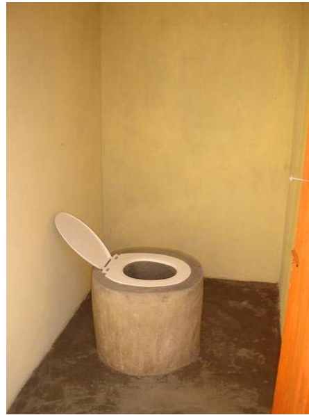
▪ Toiletten na afronding project

Op onderstaande foto zijn de bewoners van het dorp Ogoekrom te zien tijdens de officiële opening van de openbare toiletten.